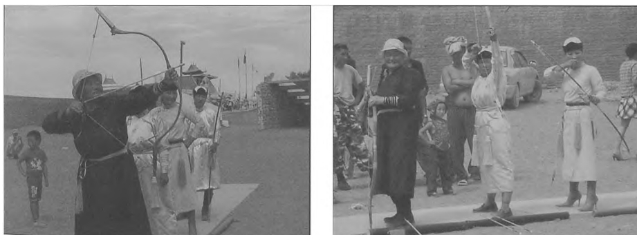
Fot. 8, 9. Zawody łucznicze (konkurencje również dla kobiet) w Dalanzadgad Phot. 8, 9. Archery competition (also for women) in Dalanzadgad

Łucznictwo – od przeszło 60 lat prawo startu mają tu również kobiety, które posiadają 20 strzał, natomiast mężczyźni 40 strzał. Strzela się do sur , plecionych rzemiennych koszyczków, których centralne miejsce zajmują czerwone, najwyżej punktowane koszyczki. Tak utworzona „tarcza”, (szerokość 4 m i wysokość 50 cm) z centralnie umieszczonymi czerwonymi koszyczkami, zostaje ustawiona na ziemi. Sędziowie przy celnym strzale podnoszą ręce i wyśpiewują zaklęte słowa uuchaj (oko byka). Okrzyk ma symboliczne znaczenie, albowiem ma odstraszać złe moce, pobudzać przyrodę do życia. Łuki mongolskie są zbudowane w tradycyjny sposób z twardego drewna i elementów kości. Strzały wykonane są z młodej wierzby, lotki z piór sępa, a groty z kości. Dystans dla kobiet – 60 m, dla mężczyzn – 75 m. Dla dzieci – liczba lat x 3 u dziewcząt, x 4 dla chłopców. Celem zawodów jest zdobycie tytułu Mergen (Dobry Strzał). Zwycięzcom dodaje się przymiotniki dokładny , zręczny . Słaby strzelec zwala winę na rękawy .