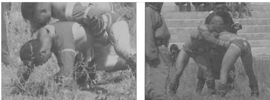
Fot. 6, 7. Fragmenty zapasów z walk w Dalanzadgad (prowincja Ömnögow) Phot. 6, 7. Fragment of wrestling competition in Dalanzadgad (province Ömnögow)

zmany. Każdy z zawodników ma swego sekundanta zagrzewającego do walki i wychwalającego jego walory. Zawodnik przegrywający przechodzi pod prawym ramieniem zwycięzcy, a zwycięzca odtworza rytualny taniec dewech orła Gerudy, mitycznego ptaka Wschodu, obiegając trzy razy podium – jako znak radości ze zwycięstwa. Triumfator Wielkiego Maadamu odbywającego się w Ulan Bator otrzymuje najbardziej prestiżowe tytuły. Za 5 zwycięstw otrzymuje się tytuł Sokola (Nachin), 7 zwycięstw tytuł Słonia (Dzaan). Dalsi zwycięzcy otrzymują przymiotniki takie jak Niezwycięzony Gigant czy Potężny Niezwycięzony Gigant . Dotychczas najmłodszy zwycięzca miał 22 lata, a najstarszy 43.