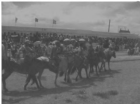
Fot.11. Dekoracja najmłodszych zwycięzców w Dalandzadgad, Fot.12. Parada zwycięzców Phot. 11. Decoration of the youngest winners in Dalandzadgad, Phot. 12. Parade of winners