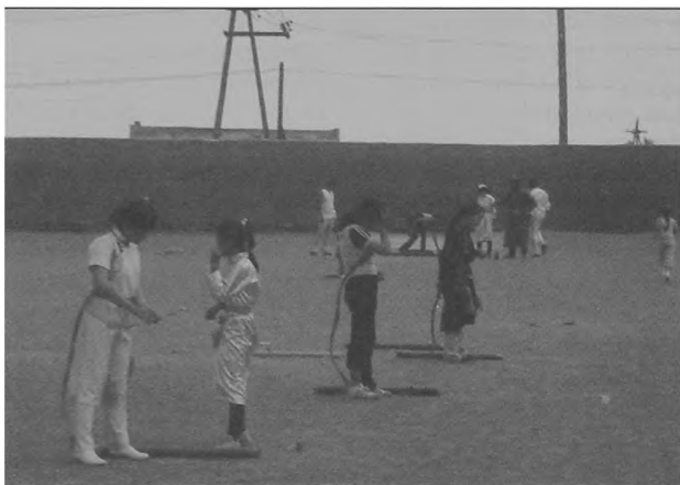
Fot. 10. Zawody łucznicze dzieci Phot. 10. Archery competition of children

Wyścigi konne – (Mongol rodzi się w siodle), najbardziej ekscytująca dyscyplina dla Mongołów. Jeźdźcy mają wyrobioną technikę jazdy, odbiegającą od europejskiej. Małe konie i specyficzne drewniane siodła nie ułatwiają jazdy osobom nie wprawionym.