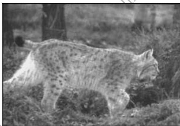
Fot. 5–6. Finlandia jest krajem jezior i lasów, gdzie jeszcze można spotkać rysia [Korhonen, Sokala 2006, s. 47] / Finland is a land of lakes and forests, where one can meet a lynx.