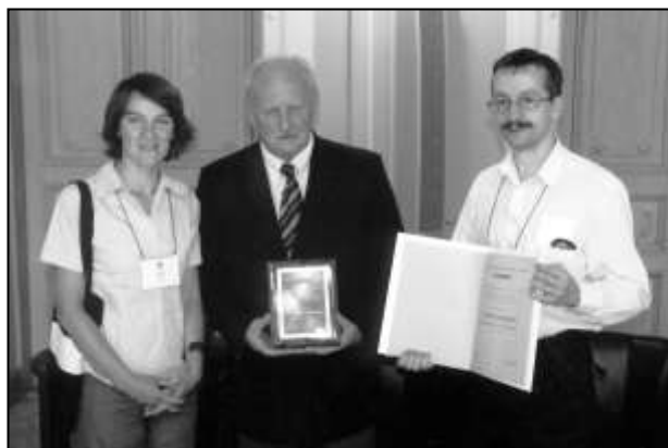
Fot. 4. Nagroda dla Wydziału Wychowania Fizycznego UR za zorganizowanie II Konferencji EASS. The award for Ph.E. Faculty of University of Rzeszów – for the organisation of 2 nd EASS Conference