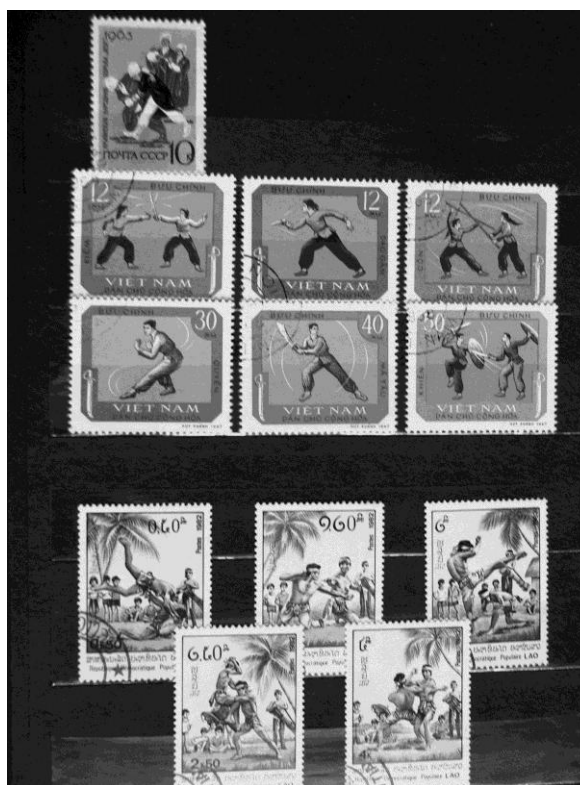
Fot. 1. Serie wietnamska i laotańska przedstawiające sztuki walki tych krajów oraz znaczek wydany przez pocztę ZSRR pokazujący ormiański sport walki koch / Photo 1. Series from Vietnam and Laos, presenting martial arts of this countries, and a stamp made in CCCR showing Armenian combat sport – koch

walki są mało widoczne. Częściej wyobrażenia związane z tradycjami kultur wojowników i sztuk walki pojawiają się na znaczkach pocztowych krajów, z których kultury się wywodzą. Wówczas te właśnie małe formy graficzne służą promocji samych oryginalnych sztuk walki i krajów ich pochodzenia (fot. 1).