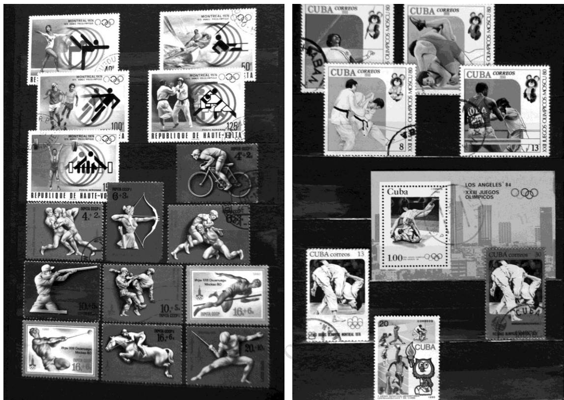
Fot. 17. Serie „preolimpijskie” Republiki Górna Wolta (1975) i ZSRR (1977) / Photo 17. Preolympic series of Republic de Haute-Volta (5 v., 1975) and CCCR (1977)

z Umm-al-Qiwain o nominale 1 riyal, wiele znaczków kubańskich i wiele innych. Na fot. 18 pokazano stronę klasera ze znaczkami kubańskimi z IO w Montrealu, Moskwie i Los Angeles oraz z V Igrzysk Sportowych Studentów Ameryki Środkowej i Karaibów (20 correos, 1986 r.), gdzie jūdō jako sport (wyobrażenie walczących dzudoków) pojawia się obok 4 innych dyscyplin sportu.