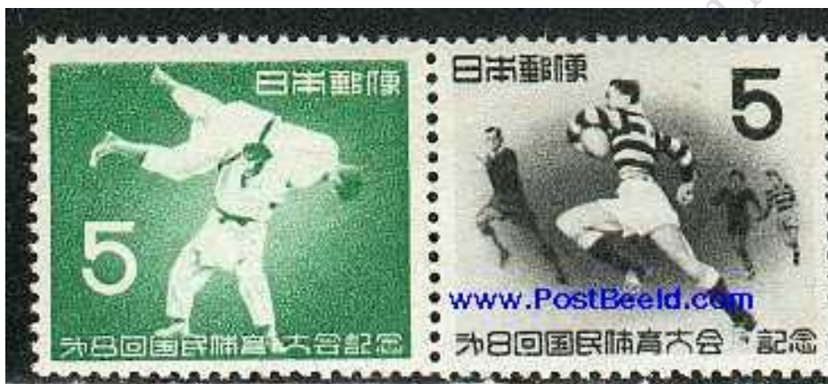
Fot. 5. Japonia – „Sporty”, 1953 / Photo 5. Japan – „Sports”

4.1. 1953 r., seria „Sporty” – 2 znaczki po 5 jenów ( jūdō – rzut kata-guruma i rugby 4 – bieg z piłką) (fot. 5);