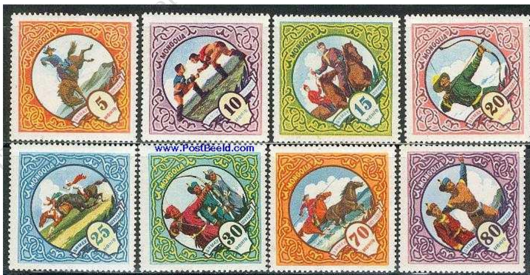
Fot. 11. Mongolia, 1959: Sporty narodowe / Photo 11. Mongolia, 1959: National sports, 8v

8.1. 1959: Sporty narodowe (w 8-znaczkowej serii pokazano jeździectwo, łucznicstwo i tradycyjne mongolskie zapasy , fot. 11);