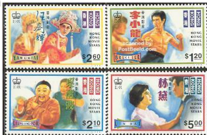
Fot. 4. Gwiazdy kina Hongkongu, 1995, 4-znaczkowa seria / Photo 4. Hong Kong, 1995: Movie stars 4v

2.1. 1995: Gwiazdy kina Hongkongu, 4-znaczkowa seria – na znaczku o nominale 1,20 $ pokazano scenę z filmu „Droga Smoka” (Bruce Lee w walce z Chuckiem Norrisem, fot. 4);