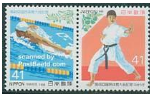
Fot. 6. Japonia, „Igrzyska Narodowe” 1983 / Photo 6. Japan, National games 1983, 1v. Fot. 7. Japońska seria „Igrzyska Narodowe” 1993 – 2 znaczki / Photo 7. Japan, National games 1993, 2v.