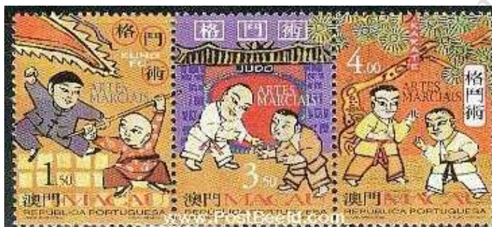
Fot. 10. Makao, 1997: „Tradycyjne sporty walki” / Photo 10. Macau, 1997: Traditional fighting sports, 3v

7.4. 1997: „Tradycyjne sporty walki”, właściwie wushu / kung-fu – seria 3-znaczkowa (fot. 10).