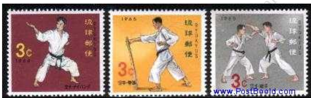
Fot. 12. Riukiu (Okinawa), 1964: seria poświęcona karate / Photo 12. Ryu Kyu, 1964: Karate, 3v