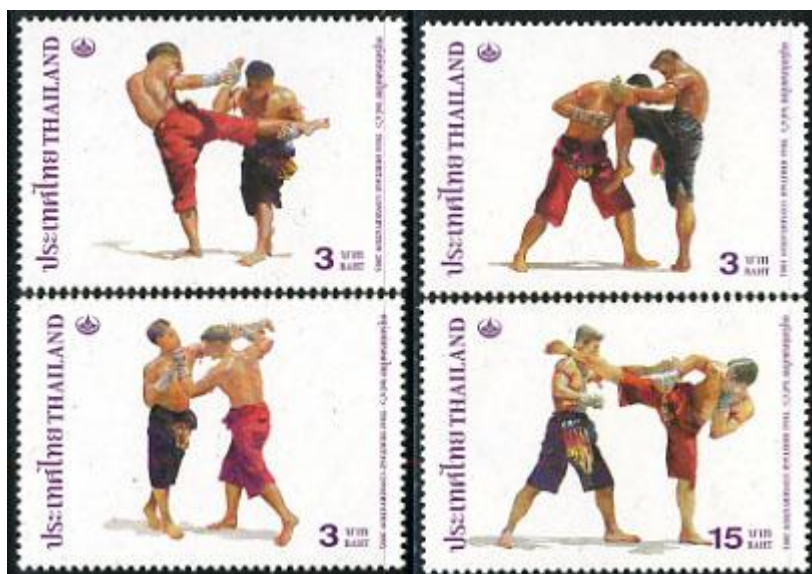
Fot. 14. Boks tajski / Photo. 14. Thailand, 2003: Boxing, 4v