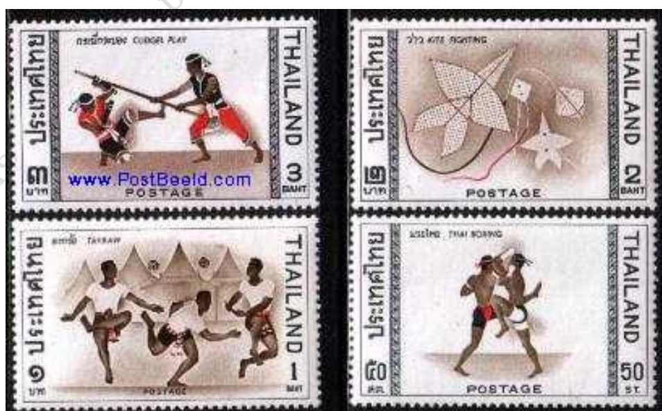
Fot 13. Narodowe sporty Tajlandii / Photo 13. Thailand, 1966: Sports, 4v