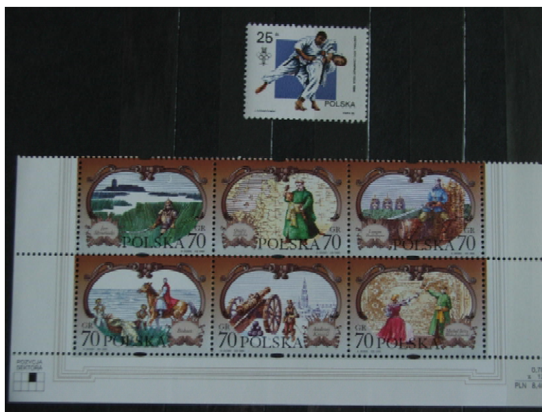
Fot. 2. Polskie znaczki: walka dżudoków (IO Seul 1988) i seria „Bohaterowie Trylogii” / Photo 2. Polish stamps: fighting of judoists (Olympic Games Seoul 1988) and „Heroes of Trilogia ” series

Może jest czas ku temu, aby wzorem organizacji sportowych i ruchu olimpijskiego także środowisko dsw zaczęło wydawać okolicznościowe kartki i stemple?