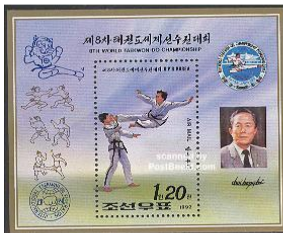
Fot. 9. Korea Północna, 1992: MŚ w taekwondo / Photo 9. North Korea, 1992: WC Taekwondo, s/s

5.3. 1992: MŚ w taekwondo ITF (bloczek ze zdjęciem gen. Choi Hong Hi, fot. 9);