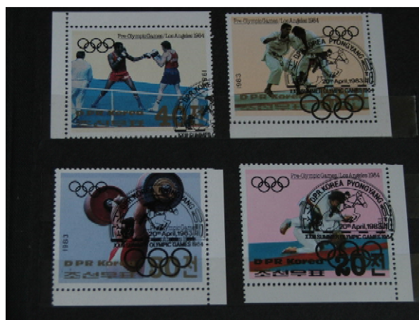
Fot. 8. Seria znaczków „przedolimpijskich” z KRLD, 1983 / Photo 8. Series of DPR Korean, „Pre-Olympic” stamps

5.1. 1966: „GANEF0 games”, 3 znaczki (w tym 1 z jūdō );