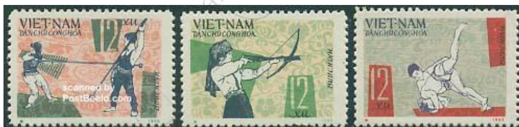
Fot. 15. Wietnamskie igrzyska narodowe, 1966 / Photo 15. Vietnam, 1966: National games, 3v