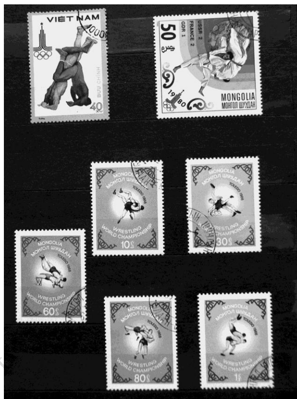
Fot. 16. Znaczki mongolskie i wietnamski – zapasy i jūdō / Photo. 16. Stamps from Mongolia and Vietnam – wrestling & judo

Jeśli Japonia promuje swe jūdō i kendō , Koreańczycy – taekwondo , Tajowie – muai thai , Indonezyjczycy – silat , Chińczycy – wushu lub kuoshu , bardziej znane na Zachodzie jako kung-fu , a np. Ormianie – koch , jest to jednocześnie promocja własnej kultury. Sukcesy sportowe w IO lub sportach nieolimpijskich (jak osiągnięcia Mongołów w sumō ) także służą promocji kraju, a odpowiednie emisje tematyczne na znaczkach pocztowych są w tym pomocne. Polityka filatelistyczna służy zarówno autoidentyfikacji kulturowej, dokumentacji faktów i rozwijaniu uczuć patriotycznych w danym kraju, jak też zewnętrznej promocji. Dzięki temu znaczki pocztowe uczestniczą w dialogach i wymianach kulturowych w skali globalnej [por.: Godlewski 2000; Tokarski 2000, 2003; Cynarski 2002, 2006; Obodyński, Cynarski 2003].