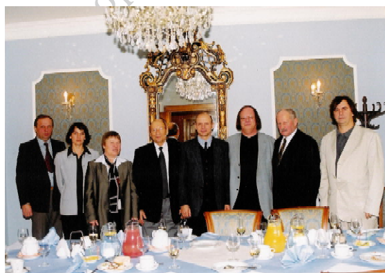
Fot. 2. Spotkanie z Tadeuszem Ferencem – prezydentem Rzeszowa / Photo 2. Meeting with the president of Rzeszów, T. Ferenc

Socjologia sportu, będąca subdyscypliną socjologii kultury, w ostatnich latach rozwija się bardzo dynamicznie. W Polsce prym wiedzie tutaj Katedra Nauk Społecznych AWF w Warszawie, z którą blisko współpracuje rzeszowski Wydział Wychowania Fizycznego UR. Efektem działań zrzeszonych w EASS socjologów, a także filozofów i pedagogów kultury fizycznej, była zorganizowana w Rzeszowie i Łańcucie druga międzynarodowa konferencja tego stowarzyszenia. Konferencję poprzedziło kilka spotkań, konsultacji i sympozjów z władzami EASS [Cynarski 2003a, b, 2004] (fot. 2, 3).