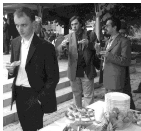
Fot. 11. Bankiet powitalny konferencji w Bledzie / Photo 11. A welcome party at the conference in Bled