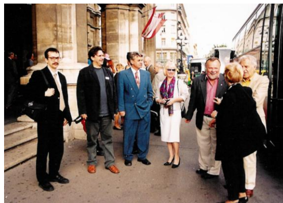
Fot. 1. Grupa Polaków obok Opery Narodowej. Konferencja w Wiedniu, 2002 / Photo 1. Group of Poles next to National Opera. Vienna Conference 2002