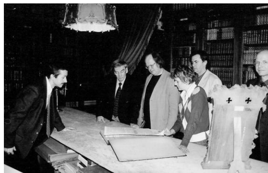
Fot. 4. Podczas konferencji w Łańcucie i Rzeszowie, w bibliotece na zamku Potockich / Photo 4. Before the conference in Łańcut and Rzeszów, in library in the Potocki castle

Największym chyba powodzeniem cieszyła się poprowadzona przez prof. S. Tokarskiego (PAN) i dr Attilę Borbély’ego (Węgry) sesja poświęcona dialogom kulturowym realizowanym na obszarze sportu. Obrady rozpoczął Stanisław Tokarski bardzo ciekawym referatem