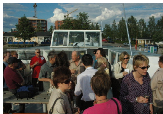
Fot. 8. Rejs statkiem po urokliwym jeziorze podczas konferencji w Jyväskylä / Photo 8. Sailing on a charming lake during the conference in Jyväskylä