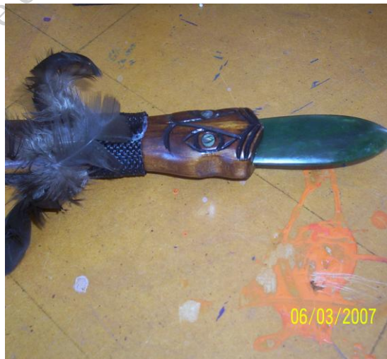
Fot. 8. TAIAHA-RAU – ostrze z zielonego kamienia / Photo 8. TAIAHA-RAU – a blade from green stone

TEWHATEWHA była uważana za broń wodza wydającego komendy, widywana u dowódców na polach bitew, na łodziach trzymana w dłoni przez głównego żeglarsza nadającego rytm wiosłowania. Wykonana z twardego drewna, o długości 1,1 metra, bogato zdobiona płaskorzeźbami i kolorowymi piórami.