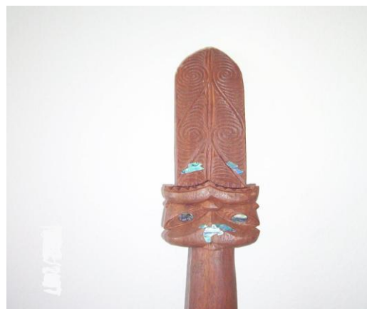
Fot./Photo 6. TAIAHA

Budowa tej broni podzielona jest na trzy sekcje. Pierwsza z nich to ostrze RAU, następnie trzonek o lekko owalnym przekroju i zakończenie ARERO w kształcie głów odwróconych od siebie. Często Taiaha inkrustowana była łupiną małży PAUA w formie oczu powyżej arero. Większość Taiaha była ozdobiona czerwonymi piórami i dodatkowo sierścią psa, Taiaha była uważana za symbol władzy prezentowana podczas narad i zgromadzeń przez wodzów. Technika walki tą bronią polegała na trzymaniu jej w poziomie (pozycja defensywna) lub lekkim ukosie z ostrzem skierowanym w kierunku przeciwnika. Była to jednocześnie broń defensywna i ofensywna, trzymana w obu rękach. W czasie walki stosowano uniki i wypady, doświadczeni wojownicy bez przerwy poruszali bronią zmieniając pozycję do uzyskania jak najlepszego momentu zadania ciosu. Ulubioną taktyką wojowników było przerwianie Taiaha przy markowaniu ciosu i zadawanie go drugą stroną, w czubek głowy przeciwnika [Taonga Tuku Iho 2002].