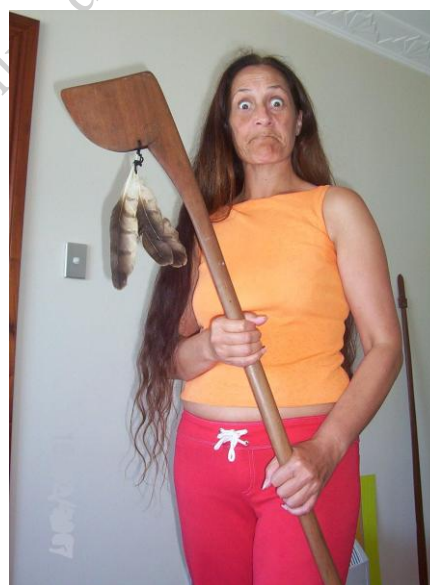
Fot. 10. Maoryska z TEWHATEWHA / Photo10. Maori woman with TEWHATEWHA

Ostatni rodzaj włóczni to TIMATA – zwana też TORO o średniej długości, służyła zarówno do rzucania jak i do walki ręcznej z ostrym zakończeniem.