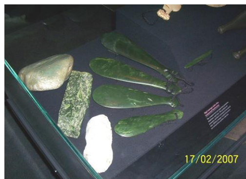
Fot./Photo 4. MERE POUNAMU

W walce Patu i Mere było wykorzystywane jako broń ofensywna i używano jej głównie do atakowania głowy przeciwnika oraz jego witalnych punktów. Podstawowe uderzenie przewidywało poziomy atak wymierzony w okolice skroni. Stosowane było także uderzenie pod żebra, zadawane od dołu ku górze. W czasie użytkowania broń była ciasno owinięta wokół nadgarstka sznurkiem, połączonym z PATU w specjalnie nawierconym otworze [Taonga Tuku Iho 2002].