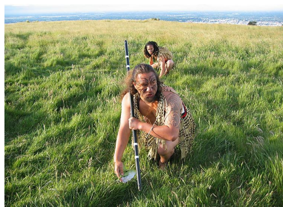
Fot./Photo 12. Maoryscy wojownicy / Maori warriors

Charakterystycznym dla Maorysów elementem poprzedzającym walkę była i jest wykonywana przez wojowników rytualna HAKA. W literaturze przedmiotu spotykamy podobne tańce np.: Kalaripayatt (Indie) Waigru (Tajlandia) [Tokarski 1989]. Maoryska Haka to bardzo energiczna manifestacja agresji, siły i sprawności, wykonywana przez grupy wojowników w jednolitym rytmie nadawanym przez lidera. W swej odmianie PERUPERU jest demonstracją negatywnych emocji i zachętą wojowników do walki. Haka PERUPERU prawie zawsze obejmuje pokaz broni. Wytrzeszczone oczy i języki tancerzy poruszane są w wyzywającym geście PUKANA, połączenie gestów z eksponowaniem broni miało na celu odstraszenie przeciwnika, a bezbłędne wykonanie tańca zapewniało powodzenie w walce. Współcześnie taniec HAKA stał się popularnym na całym świecie elementem towarzyszącym występom reprezentantów sportów zespołowych Nowej Zelandii (np.: reprezentacji Rugby „All Blacks”).