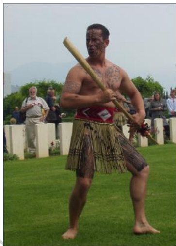
Fot 7. Wojownik maoryski z TAIAHA / Photo 7. Maori Warrior with TAIAHA

Budowa tej broni podzielona jest na trzy sekcje. Pierwsza z nich to ostrze RAU, następnie trzonek o lekko owalnym przekroju i zakończenie ARERO w kształcie głów odwróconych od siebie. Często Taiaha inkrustowana była łupiną małży PAUA w formie oczu powyżej arero. Większość Taiaha była ozdobiona czerwonymi piórami i dodatkowo sierścią psa, Taiaha była uważana za symbol władzy prezentowana podczas narad i zgromadzeń przez wodzów. Technika walki tą bronią polegała na trzymaniu jej w poziomie (pozycja defensywna) lub lekkim ukosie z ostrzem skierowanym w kierunku przeciwnika. Była to jednocześnie broń defensywna i ofensywna, trzymana w obu rękach. W czasie walki stosowano uniki i wypady, doświadczeni wojownicy bez przerwy poruszali bronią zmieniając pozycję do uzyskania jak najlepszego momentu zadania ciosu. Ulubioną taktyką wojowników było przerwianie Taiaha przy markowaniu ciosu i zadawanie go drugą stroną, w czubek głowy przeciwnika [Taonga Tuku Iho 2002].