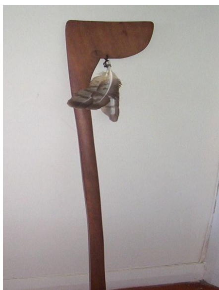
Fot./Photo 9. TEWHATEWHA

TERERAREA jedna z najmniejbezpieczniejszych drewnianych włóczni o długości około 3 metrów z ostrzem, które posiadało dodatkowe kolce, skonstruowane tak, aby łamało się w ciele ugodzonego przeciwnika.