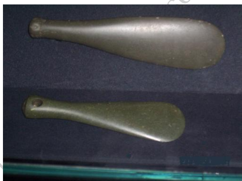
Fot./Photo 3. MERE POUNAMU

MERE POUNAMU była prawdopodobnie najbardziej szanowaną bronią Maorysów. Wpływ na to miał wysiłek wkładany w wytworzenie takiej broni, a także niedostępność POUNAMU (zielony kamień-jadeit) w większości rejonów Aotearoa. Mere Pounamu wykonywane było ze szlifowanego jadeitu o rozmiarach wahających się od 24 do 43 cm długości. Pierwszym krokiem wykonania Mere było wycięcie odpowiedniego bloku ze skały, następnie formowano jego kształt przy pomocy specjalnych młotków, a po uzyskaniu odpowiedniego kształtu całość szlifowano w wyżłobionych skałach. Skała, z której powstawało Mere, jest niezwykle twarda, dlatego obróbka wymagała wiele cierpliwości. Ze względu na ogromny wysiłek wkładany w wytwarzanie miecz, broń ta była bardzo cenna, przekazywana z pokolenia na pokolenie, często nadawano jej imiona, a także składano do grobu razem z wojownikiem.