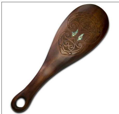
Fot./Photo 1. PATU