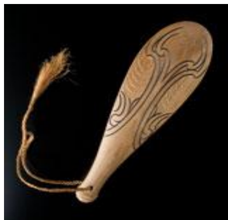
Fot./Photo 2. PATU

Pośród PATU i MERE można wyróżnić PATU PARAOA, która była robiona zwykle z kości kaszalota i była wyjątkowo wytrzymałą i dobrze wyważoną bronią. Symetryczna w swej formie była prostą bronią o płaskim ostrzu, z których każdy egzemplarz różnił się rozmiarem i kształtem. Większość Patu Paraoa miała średnią długość 43 cm i grubość 1,5–2 cm w najgrubszym punkcie. Można przyjąć, że Patu powstawały z kości ciemieniowej kaszalota.