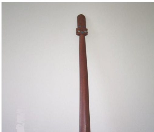
Fot./Photo 5. TAIAHA